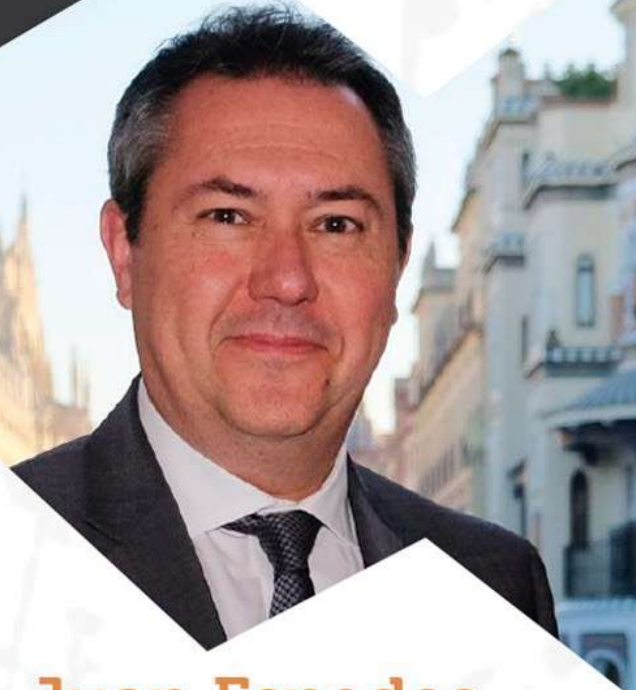
D. Juan Espadas Alcalde de Sevilla