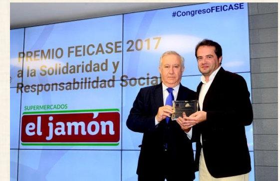
Premio Solidaridad y RSE Supermercados El Jamón