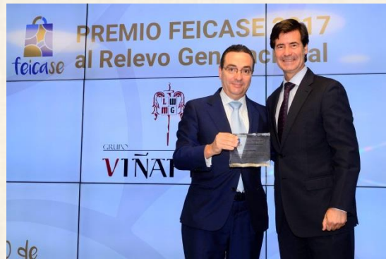
Premio Relevo Generacional Grupo Viñafiel