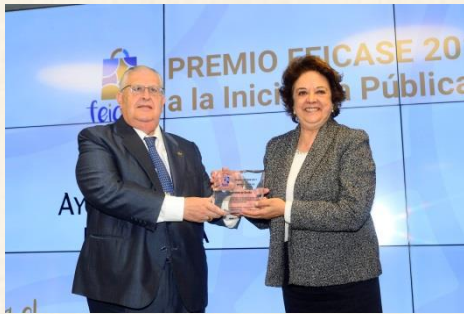
Premio Iniciativa Pública Ayuntamiento de Sevilla y Prodetur-Diputación de Sevilla