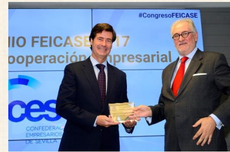
Premio Cooperación Empresarial Confederación de Empresarios de Sevilla - CES