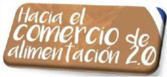
I CONGRESO FEICASE Año 2017 Hacia el Comercio de Alimentación 2.0