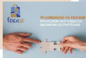
VI CONGRESO FEICASE Año 2023 Proveedor-Distribuidor, un binomio estratégico