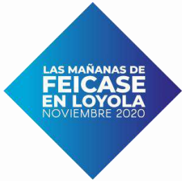
I CONGRESO DIGITAL Año 2020 Las mañanas de FEICASE en Loyola