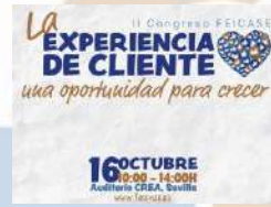
II CONGRESO FEICASE Año 2018 La Experiencia de Cliente, una oportunidad para crecer