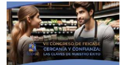
VII CONGRESO FEICASE Año 2024 Cercanía y Confianza, las claves de nuestro éxito