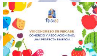
VIII CONGRESO FEICASE Año 2025 Comercio y Asociacionismo, una perfecta sinergia