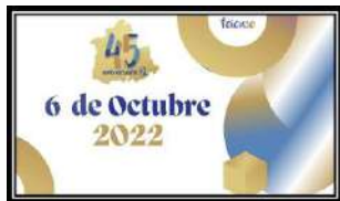
45º ANIVERSARIO FEICASE Año 2022